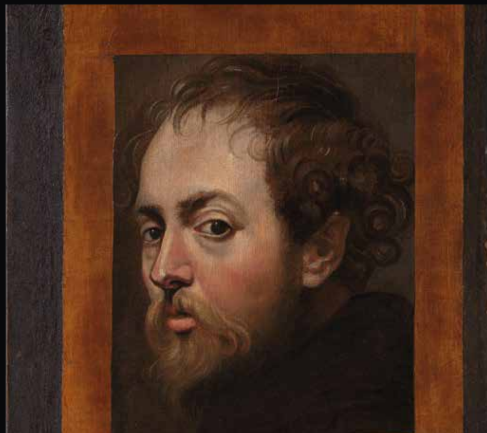
Peter Paul Rubens, il primo autoritratto, collezione privata, long term loan alla Rubenshuis di Anversa