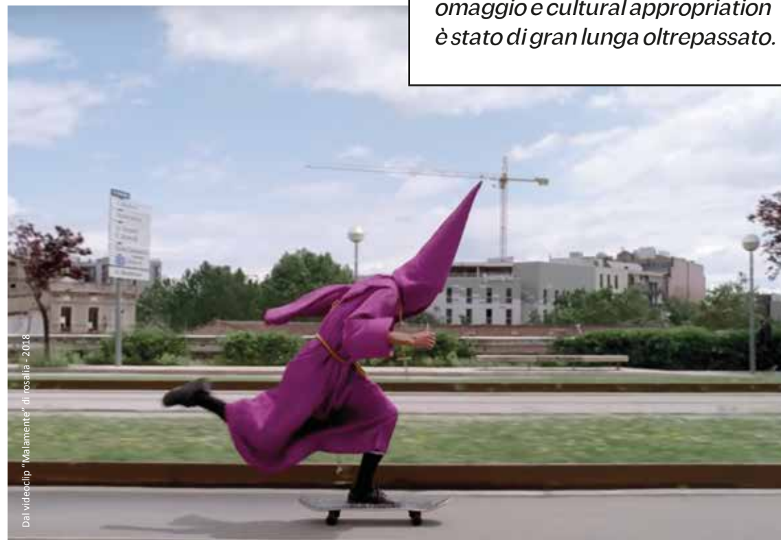
Dal videoclip "Malamente" di Rosalía - 2018

Secondo alcuni esponenti della comunità gitana, il limite tra omaggio e cultural appropriation è stato di gran lunga oltrepassato.