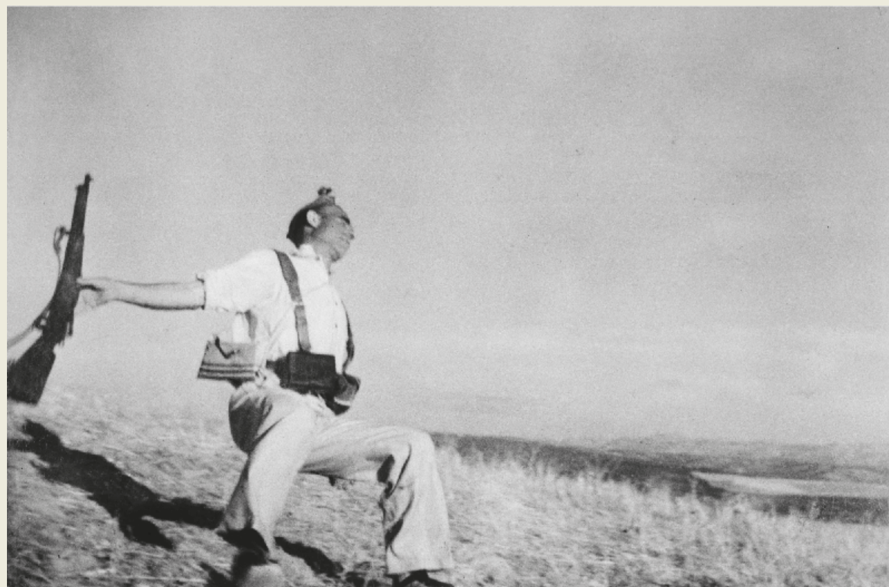
Gerda Taro. Miliziana repubblicana si addestra in spiaggia, Fuori Barcellona, 1936 Gift of Cornell and Edith Capa, 1986 Courtesy International Center of Photography

Infine in "Michele Pellegrino. Fotografie (1967-2023)" sono oltre 50 le immagini che ripercorrono i momenti salienti dell'opera del fotografo nativo di Chiusa Pesio dal 14 febbraio al 14 aprile . Grazie alla curatela di Barbara Bergaglio e al testo di Mario Calabresi si potrà esplorare un percorso creativo, dominato dalla presenza delle montagne con ritualità, volti e momenti del mondo contadino, che raccontano la passione di Pellegrino per la sua terra e per la fotografia.