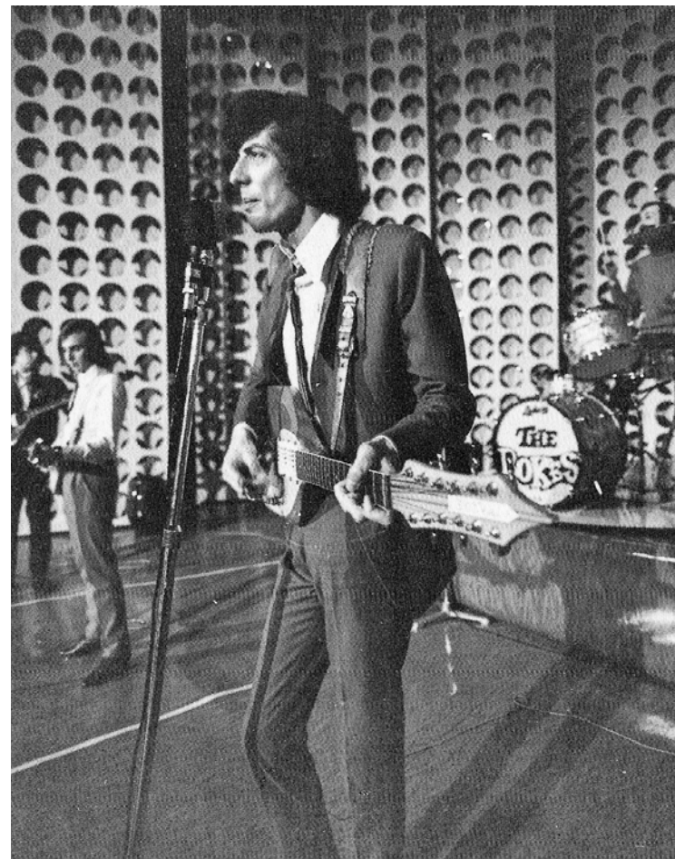
I Rokes al festival di Sanremo 1967 Dal Dizionario Curcio della Canzone Italiana, v. 6, p. 25 Sullo sfondo la scenografia Space Age

alti che ci ricorda che guardare Sanremo è un po' come sfogliare una rivista di arredamento sorvegliando qualcosa di frizzante: un mix di nostalgia e sogni per amanti dello spettacolo, purché sia ben arredato.