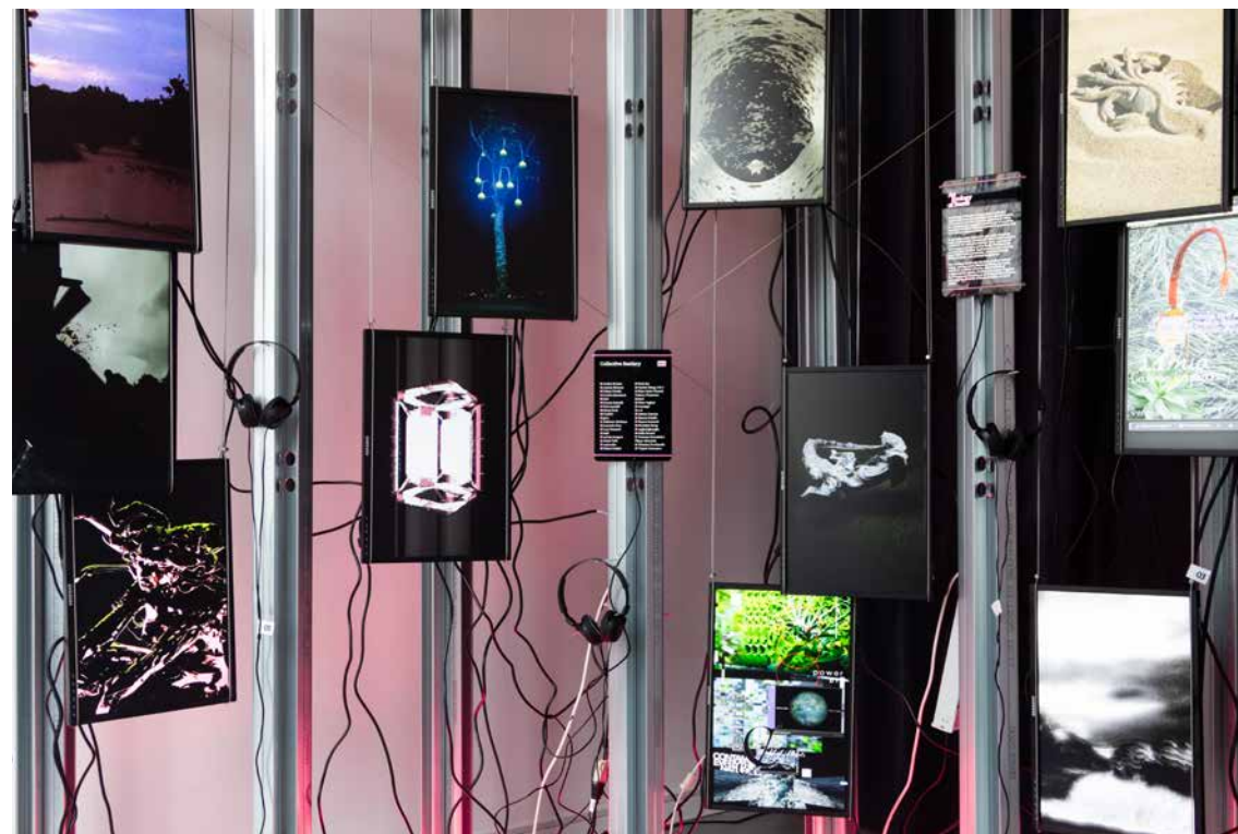
Dalla mostra Common Index

A Milano nasce un nuovo collettivo di designer che propone un paradigma di creatività libera e collettiva