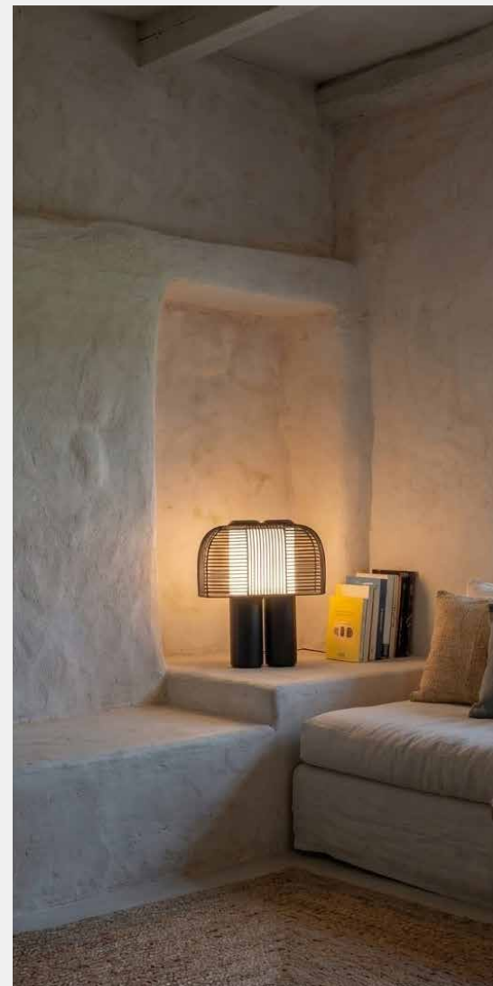
La lampada Yasuke di DCW Éditions

L'estetica Japandi impone quindi una selezione spietata dei pezzi di cui circondarsi: la qualità del singolo elemento vince sulla quantità . L'obiettivo? Una casa che non urli "guardami!", ma che sussurri "rilassati". Perché in fondo, tra una polpetta svedese e un sashimi, il vero lusso è aver vinto la tentazione di comprare l'ennesimo sovrappannabile di dubbio gusto .